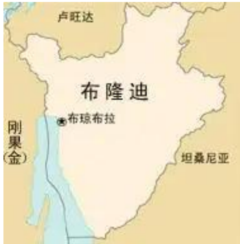
图 1 布隆迪地图

布隆迪地处非洲中部赤道南侧，国土面积为 2.7834 万平方公里。东部和东南部与坦桑尼亚交界，西南部毗邻坦噶尼喀湖，西部与刚果（金）为邻，北部与卢旺达接壤，属内陆国家。布隆迪发现的矿产资源主要有镍、稀土、泥炭、高岭土、黄金、磷酸盐、钒和锡等。近年来，布隆迪加大了矿产开发力度并开始出口，主要出口产品为黄金和稀土，2020 年黄金出口额达到 4446 万美元，超过其传统出口产品（咖啡和茶），成为其出口创汇第一来源。